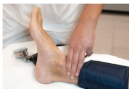
IV. Colocación do manguito de presión