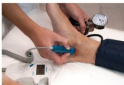
V. Determinación da presión sistólica da arteria tibial posterior