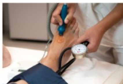
VI. Determinación da presión sistólica da arteria dorsal do pé