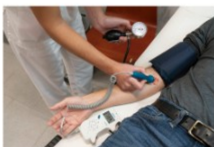
III. Determinación da presión sistólica da arteria braquial