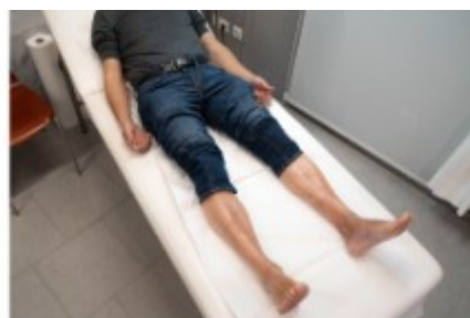
II. Posición do paciente