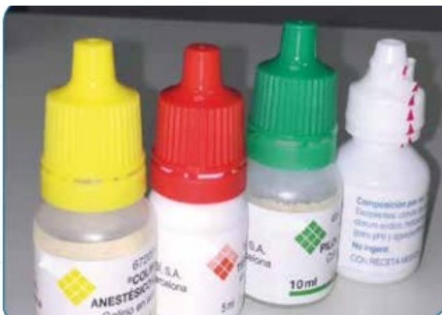
Figura 1. Diferentes botes de colirios con su código de color identificativo.

● Anestésico ● Midriático ● Miótico ○ Otros